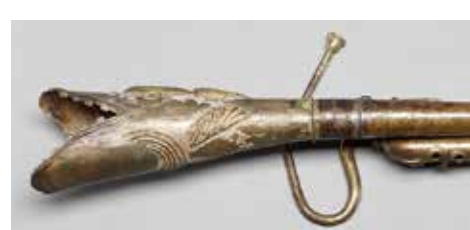
Serpent-Forveille, Frankreich, nach 1823

Suchen, Sehen, Sichtbarmachen In den Sammlungen der Staatlichen Museen zu Berlin und des Musikinstrumenten-Museums befinden sich viele Objekte, die überraschende, verborgene Geschichten und Provenienzen haben. Im Zentrum der Ausstellung „(Un)seen Stories“ stehen diese Geschichten und die Methoden, die Museumsmacherinnen nutzen, um sie zu erforschen und zu erzählen. In der sammlungsübergreifenden Präsentation unter Beteiligung des MIM im Kupferstichkabinett am Kulturforum stellen junge Nachwuchswissenschaftlerinnen mehr als 50 außergewöhnliche Objektgeschichten vor, die ihnen während ihrer Arbeit begegnet sind.